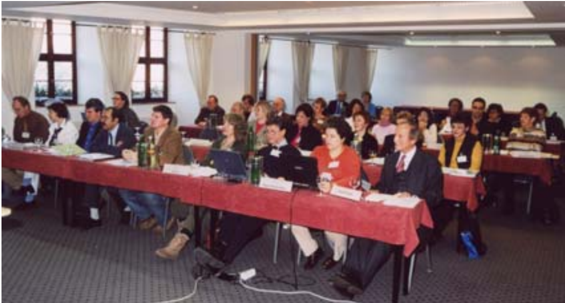
(Während der Tagung im Sorat Hotel in Erfurt)

Am 27. und 28. März 2004 tagten die Vertreter der Landesverbände auf der Jahresmitgliederversammlung des Bundesverbandes der Dolmetscher und Übersetzer e.V. in Erfurt.