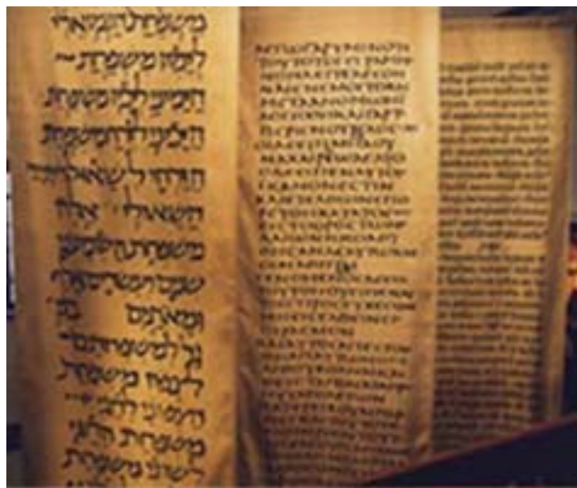
(Die Bibliothek des Augustinerklosters)

Die Bibliothek wurde im Jahr 1646 als Stiftung der evangelischen Pfarrer gegründet, die im Evangelischen Ministerium als beratende Körperschaft zusammengeschlossen sind. Die Idee einer theologischen Dienstbibliothek mit universaler Ausrichtung war 300 Jahre lang prägend für den Bestandsaufbau. Schenkungen von Privatpersonen im 18. und 19. Jahrhundert ließen die Zahl der Bücher rasch anwachsen. Derzeit umfasst der Bestand ca. 60.000 Bände und gehört damit zu den bedeutendsten kirchlichen Büchersammlungen in Deutschland. Unter den rund 13000 Handschriften und Drucken, deren Entstehungsjahr vor 1850 liegt, sind vor allem die Wiegendrucke, die Reformationsschriften und die Lutherausgaben hervorzuheben. Als wissenschaftliche Einrichtung steht die Bibliothek der Forschung heute uneingeschränkt zur Verfügung. Die Bestände sind über alphabetische und systematische Kataloge erschlossen und können im Lesesaal benutzt werden. Eine Ausleihe außer Haus ist für Bücher möglich, die nach 1900 erschienen sind.