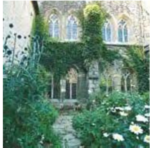
(Das Augustinerkloster zu Erfurt: Außenansicht und Innenhof)