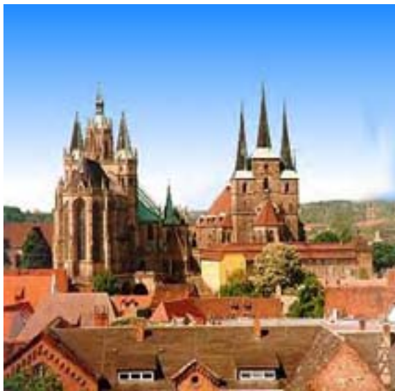
(Mariendom und Severikirche)