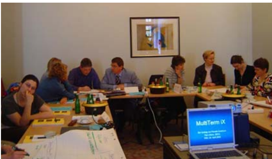
(Teilnehmer des MultiTerm-Grundlagenseminars in Köln am 24.04.2004)